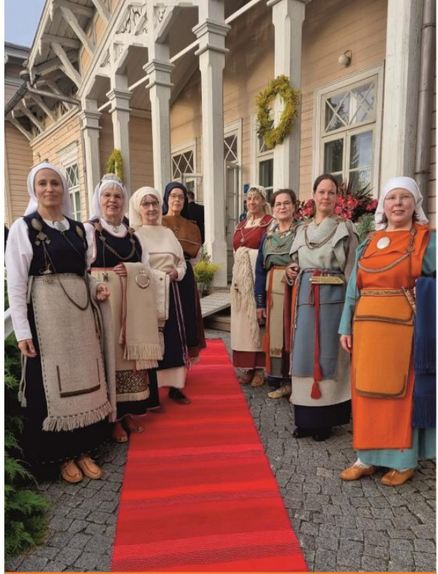
Pukuloistoa Kenkäverossa. Käsityögaalan hauska yksityiskohta on tapahtumapaikkakuntia kiertävä käsin kudottu punainen räsymatto.