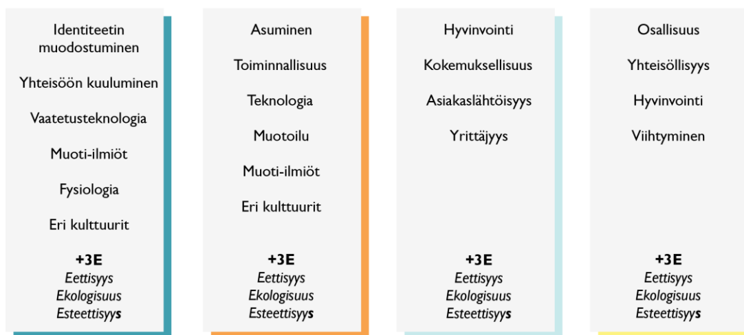
Kuvio 1. Jyväskylän käsityökoulun käsityön taiteen perusopetuksen opintokokonaisuudet, rakenne, laajuus ja sisältöalueet