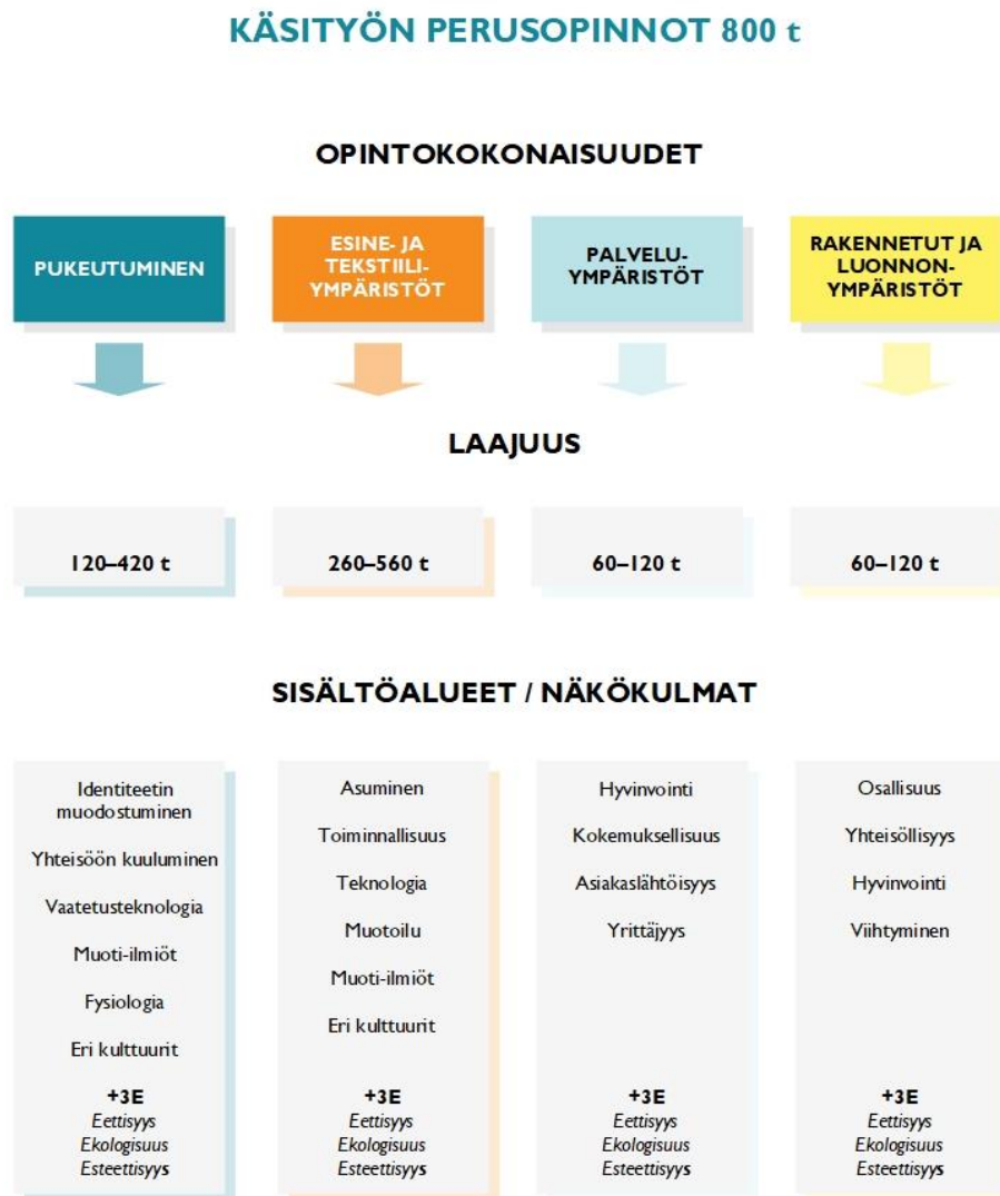
Kuvio 4. Perusopintojen opintokokonaisuudet, laajuus ja sisältöalueet

Perusopintojen opintokokonaisuudet ovat Pukeutuminen, Esine- ja tekstiiliympäristöt, Palveluympäristöt sekä Rakennetut ja luonnonympäristöt ja laajuus 800 tuntia.