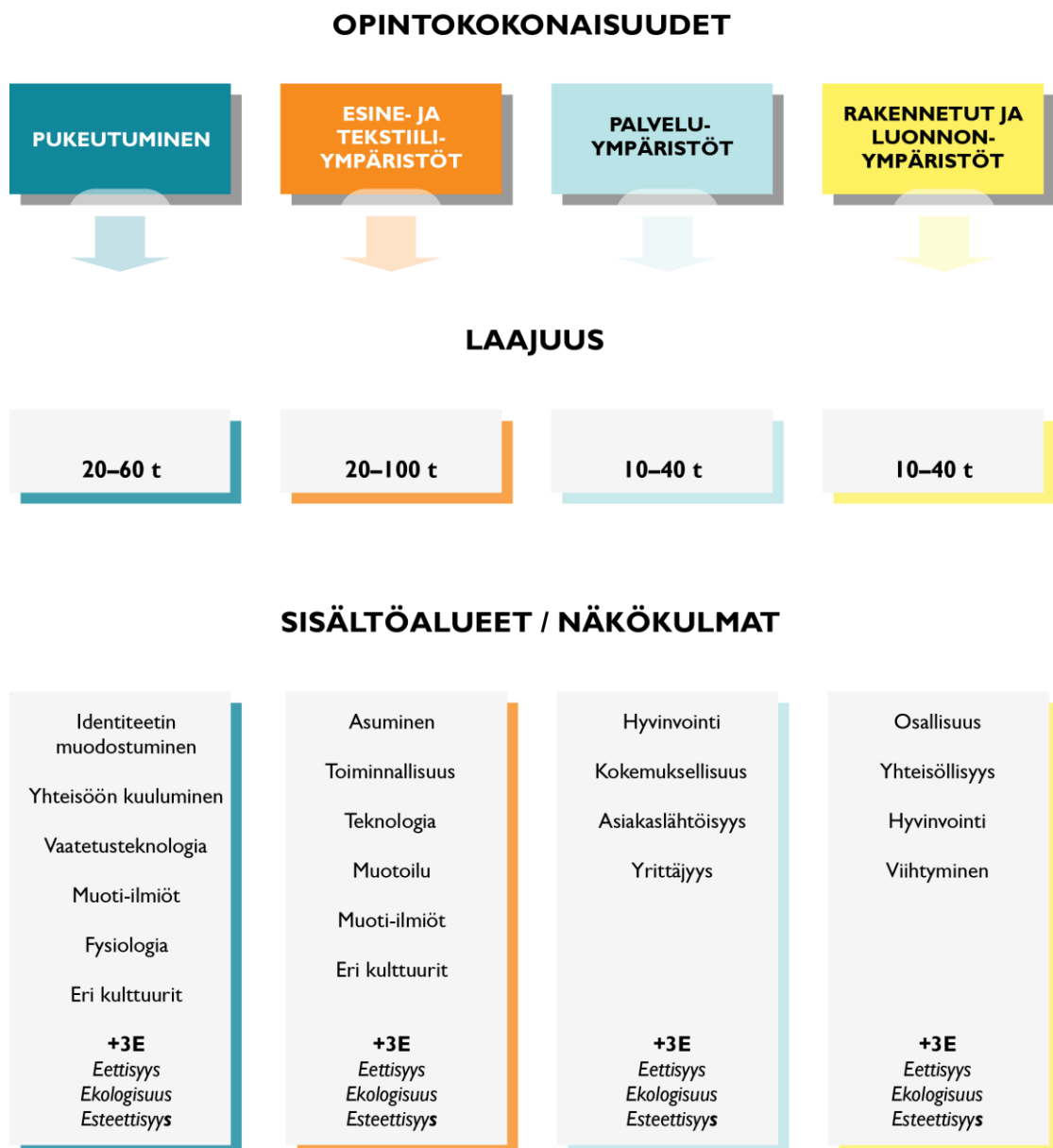
Kuvio 3. Varhaisiän käsityökasvatuksen opintokokonaisuudet, laajuus ja sisältöalueet