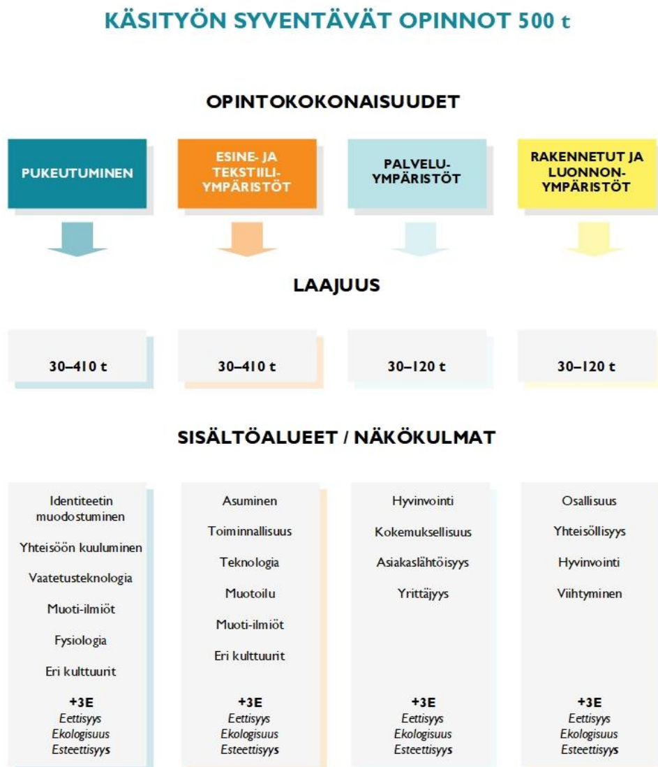
Kuvio 5. Syventävien opintojen opintokokonaisuudet, laajuus ja sisältöalueet

Syventävien opintojen opintokokonaisuudet ovat Pukeutuminen, Esine- ja tekstiiliympäristöt, Palveluympäristöt sekä Rakennetut ja luonnonympäristöt ja laajuus 500 tuntia.