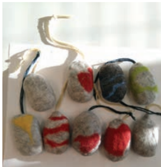
Ensimmäinen vasemmalta: Tiskiliinat