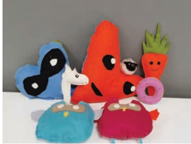
Merinohuovasta ommeltiin erilaisia pehmoleluja ja maskotteja, jotka jokainen sai suunnitella itse.