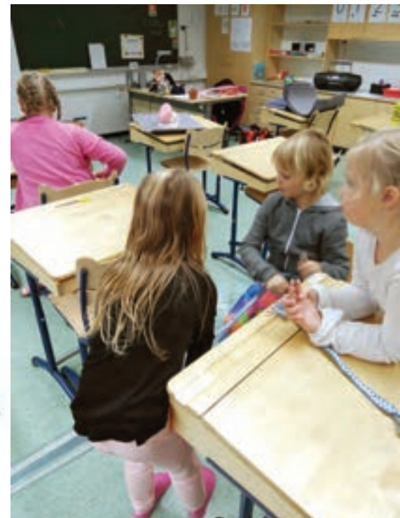
Yllä: Pirttauhan kudontaa kirjanmerkiksi.