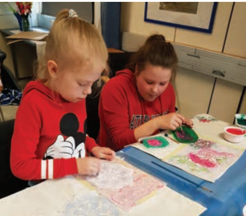
Tytöt keskittyvät kankaanpainantaan.