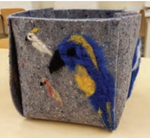
Tämän korin tekijän kotona on lemmikkinä kolme papukaijaa, jotka saivat kuvansa korin kylkeen.