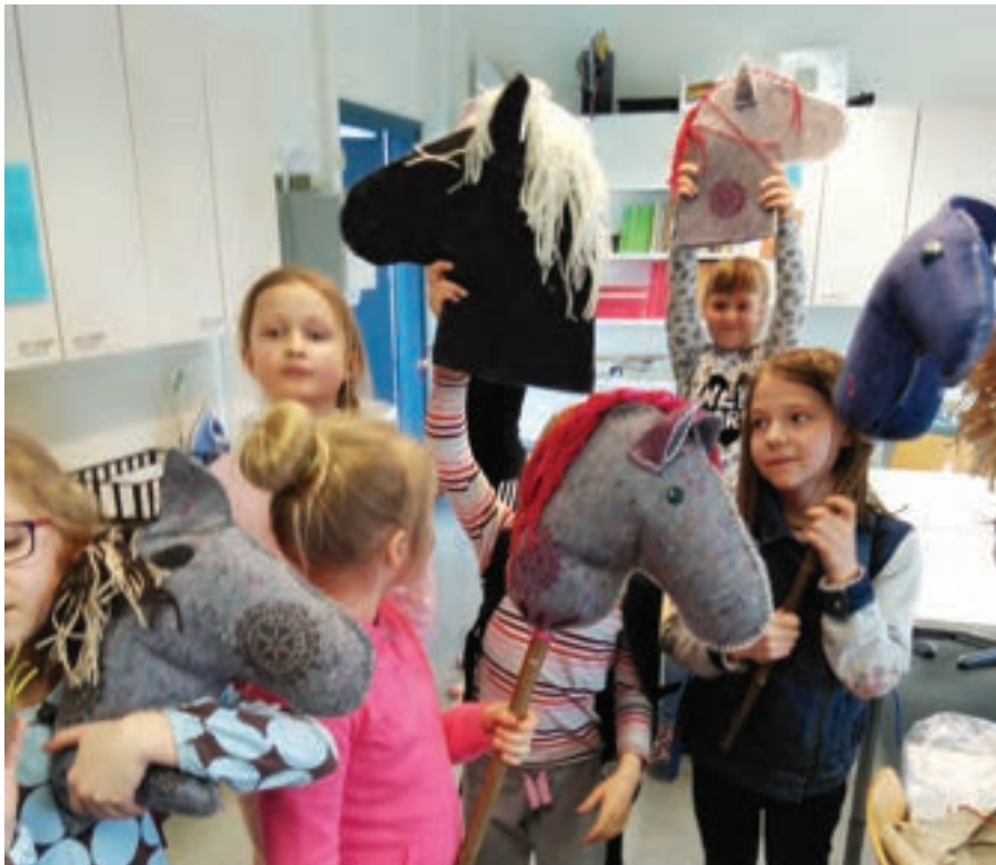
Vasemmalla: Keppihevosi kierrätyshuovasta.