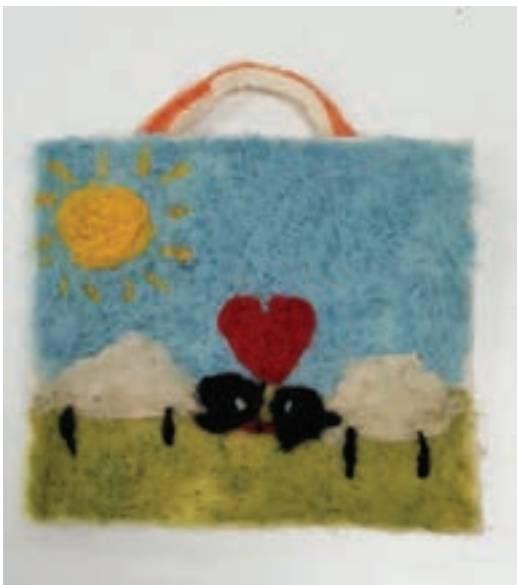
Jääkarhu-huopalevyyn huovutettu taulu syntyi taitavan kolmasluokkalaisen käsissä.

Huovutusvillapöydän ympärillä alkaa iloinen pöhinä, kun 13 lasta ryntää pöydän ympärille valitsemaan värejä. Sillä välin opettaja jakaa jokaiselle huovutusluset, neulat ja Green Craft -huovasta leikatun palasen korian varten. Ope opastaa huovutusneulan käytön ja varoittaa pitämään sormet riittävän kaukana, ettei kukaan pistä sormeensa, sillä neula on todella terävä. Lapset suunnittelevat kuviot ja kohta luokassa kuuluu hauska rapina, kun huovutusneulat uppoavat työhön.