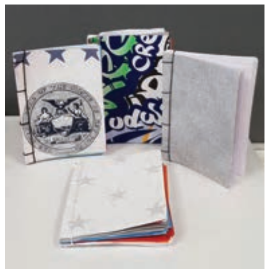
Teimme myös japanilaista kirjansidontaa. Kannot valittiin vanhoista tapettimallikirjoista.

Lasten käsissä syntyy iloisia ja värikkäitä kuvioita. Kun ensimmäiset ovat valmiita, leikataan korin reunoihin viillot, joista pujotetaan Green Craft -nauha, jolloin saadaan korin sivut pystyyn. Nauhan päät ommellaan yhteen ja lopuksi vielä ommellaan korin kulmiin pienet pistot, jotta kori pysyy ryhdissään. Innoissaan lapset suunnittelevat ja miettivät, mitä siihen koriin kotona laitetaan ja joku kertoo antavansa korin lahjaksi.