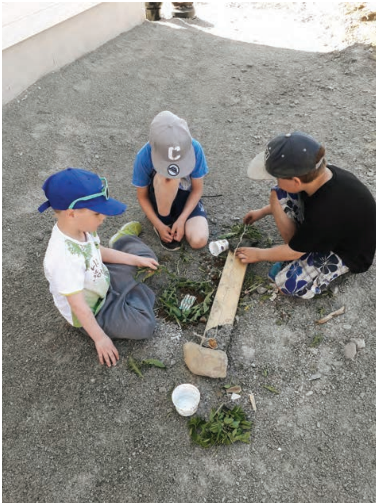
Taito Plussa -hankkeen Kässä+ -työpajoissa tutustuttiin suomalaiseen kulttuuriin, kulttuuriperintöön, vuodenaikoihin, juhlaperinteeseen, lähiluontoon ja ympäristöön.