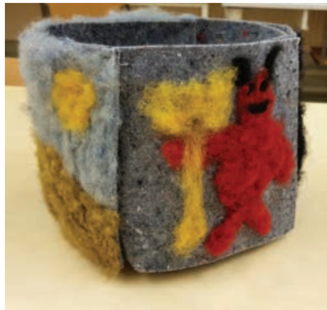
Poikien käsissä syntyi vähän hurjempia kuvioita.